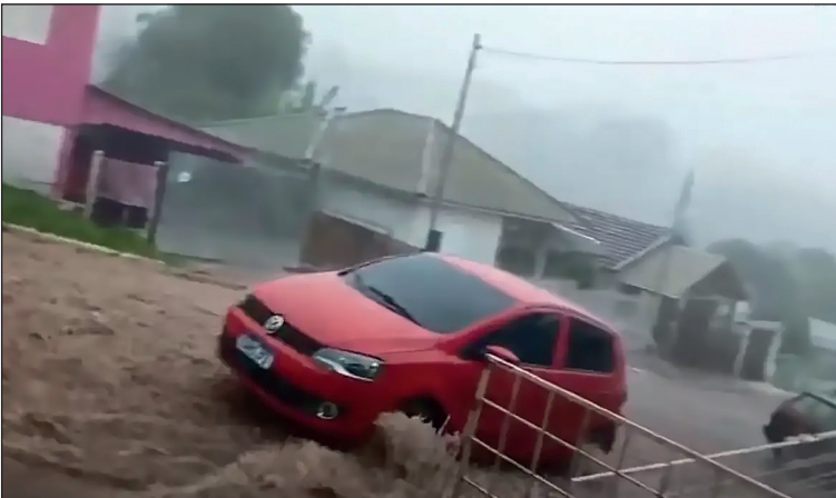
Estragos da chuva também atingiram o Rio Grande do Sul

no Rio Capivaras, na localidade da Várzea, próximo a ponte que liga o Rio Grande do Sul a Santa Catarina, entre São José dos Ausentes (RS) e Bom Jardim da Serra (SC). O corpo dele foi localizado às margens do rio no mesmo dia, conforme o órgão estadual. PARANÁ Com a morte registrada no Rio Grande do Sul, a região Sul tem ao todo sete mortes, incluindo os seis óbitos no Paraná, que foi atingido por três tornados na noite da última sexta-feira. Um dos tornados foi o que devastou a cidade de Rio Bonito do Iguaçu, com ventos de até 330 km/h, onde as mortes foram